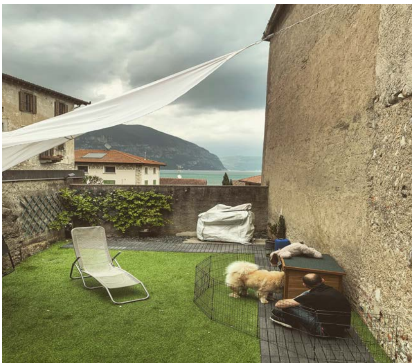
Territorio della Sovrana Assoluta, la Magnifica Clara