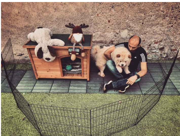
Territorio del Ministro degli interni e della Ministra delle politiche agricole

LA MAGNIFICA CLARA, IN QUEGLI ANNI LONTANI, DELIMITO' E MARCO' I CONFINI DEL SUO STATO. ERA DONNA DI GRANDE CUORE E COSI' DECISE CHE AI DUE SUDDITI SPETTAVA UN AMIPISSIMO APPEZZAMENTO DI TERRENO, MENTRE A LEI TUTTA LA PARTE RESTANTE.