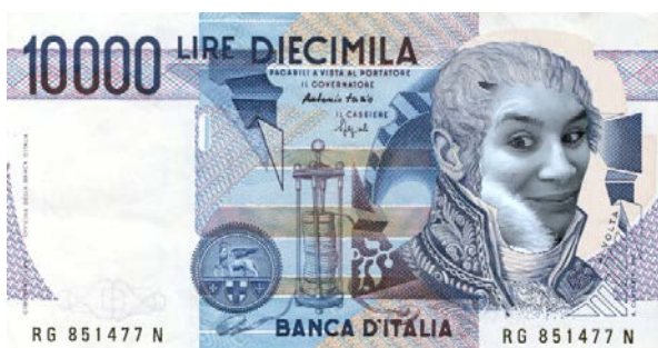
Banconote coniate dallo stato Passurinellandia, taglio dal 10.000 lire con raffigurata la Magnifica Clara

LA MAGNIFICA CLARA CONIO' ANCHE UNA MONETA PER IL SUO STATO DI PASSURINELLANDIA. UN UNICO TAGLIO, POSSEDUTO PROPRIO DALLA SOVRANA, FU RITROVATO COMPLETAMENTE INTEGRO: